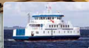
MF "Agersø III" CJC™ Oliefiltrering på Schottel Propeller